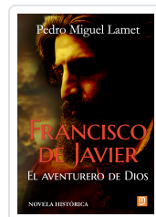
Francisco de Javier, el aventurero de Dios Lamet, Pedro Miguel