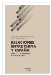
Relaciones entre China y España: génesis, desarrollo y perspectivas