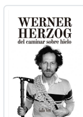
Del caminar sobre hielo Herzog, Werner