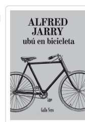
Ubú en bicicleta Jarry, Alfred