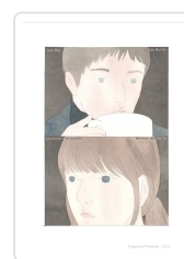
La playa más bonita del mar del Norte Burtin, Lucas; Bai, Sun