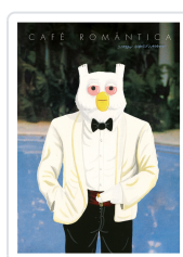
Café Romántica Hanselmann, Simon