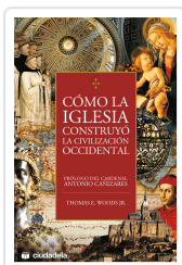
Como la Iglesia construyó la civilización occidental Woods, Thomas E.