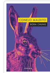
CONEJO MALDITO Chung, Bora