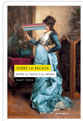
Sobre la belleza. Entre la Venus y el Ciborg Naief Yehya