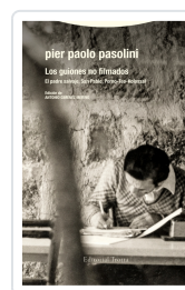
Los guiones no filmados Pasolini, Pier Paolo