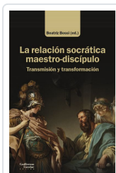
La relación socrática maestro-discipulo