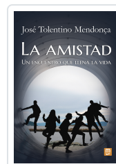
La amistad Tolentino Mendonça, José