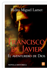
Francisco de Javier, el aventurero de Dios Lamet, Pedro Miguel