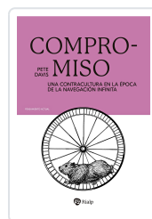
Compromiso Davis, Pete