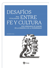
Desafíos entre fe y cultura O'Callaghan, Paul