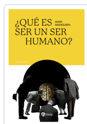
¿Qué es ser un ser humano? Aranguren Echevarría, Javier