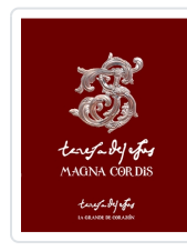
Teresa de Jesús: Magna Cordis. La Grande de Corazón Miguel Ángel González González coord