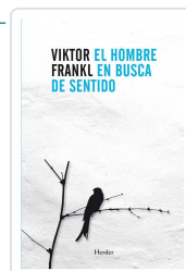
El hombre en busca de sentido Frankl, Viktor Emil