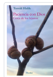
Paciencia con Dios Tomás Halik