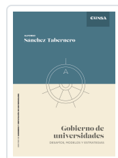
Gobierno de Universidades Sánchez-Tabernero, Alfonso