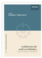
Gobierno de Universidades Sánchez-Tabernero, Alfonso