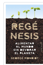
Regénesis Monbiot, George