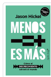
Menos es más Híckel, Jason