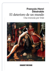
El deterioro de un mundo Désérable, François-Henri