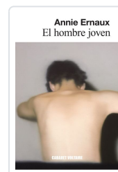
El hombre joven Ernaux, Annie