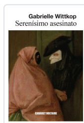
Serenísimo asesinato Wittkop, Gabrielle