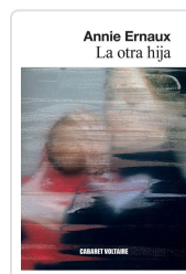
La otra hija Ernaux, Annie