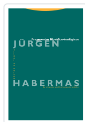
FRAGMENTOS FILOSÓFICO- TEOLÓGICOS (1ª R.) HABERMAS, JÜRGEN