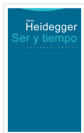
Ser y tiempo Heidegger, Martin