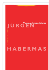
TIEMPO DE TRANSICIONES (1ª REIMPRESIÓN) HABERMAS, JÜRGEN