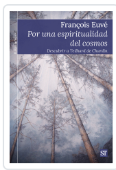
Por una espiritualidad del cosmos Euvé, François