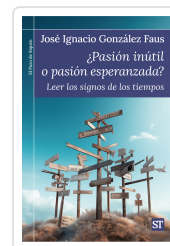
¿Pasión inútil o pasión esperanzada? González Faus, José Ignacio