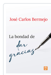
La bondad de dar gracias Bermejo, José Carlos