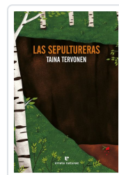
Las sepultureras Tervonen, Taina