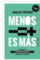
Menos es más Hickel, Jason