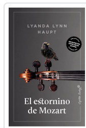
El estornino de Mozart Lynn Haupt, Lyanda