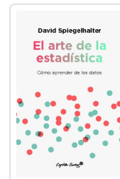
El arte de la estadística Spiegelhalter, David