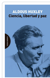
Ciencia, libertad y paz Huxley, Aldous