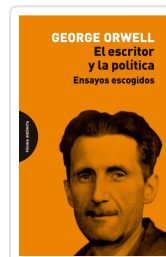
El escritor y la política Orwell, George