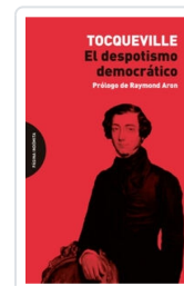
El despotismo democrático Tocqueville, Alexis de; Aron, Raymond