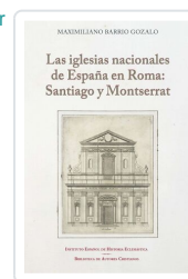
Las iglesias nacionales de España en Roma