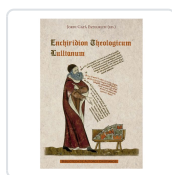
Enchiridion Theologicum Lullianum Ramon Llull