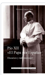
Pío XII. "El Papa por España" Vicente Carcel Ortí