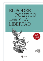
El poder político y la libertad López Amo, Ángel