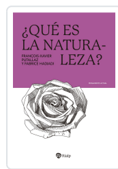
QUE ES LA NATURALEZA? Hadjadj, Fabrice; Putallaz, François-Xavier