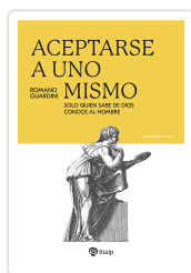
ACEPTARSE A UNO MISMO Guardini, Romano