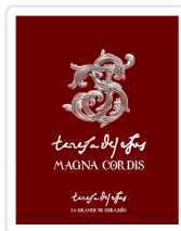
Teresa de Jesús: Magna Cordis. La Grande de Corazón Miguel Ángel González González coord