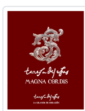
Teresa de Jesús: Magna Cordis. La Grande de Corazón Miguel Ángel González González coord