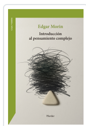
Introducción al pensamiento complejo Morin, Edgar