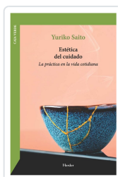
Estética del cuidado Yuriko Saito