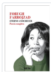
Eterno anochecer Farrojad, Forugh