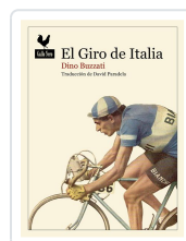
El Giro de Italia Buzzati, Dino