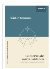
Gobierno de Universidades Sánchez-Tabernero, Alfonso