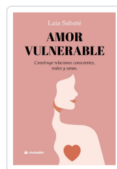
Amor vulnerable Sabaté, Laia