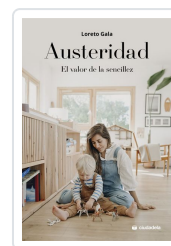
Austeridad Gala, Loreto