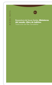
Miniaturas del mundo Santos, Boaventura de Sousa