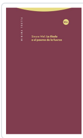
La 'Iliada' o el poema de la fuerza Weil, Simone