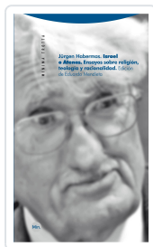
ISRAEL O ATENAS (2ª ED.) HABERMAS, JÜRGEN