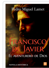
Francisco de Javier, el aventurero de Dios Lamet, Pedro Miguel