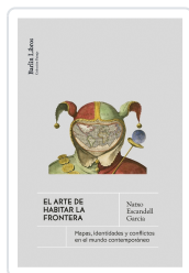
El arte de habitar la frontera Escandell García, Natxo