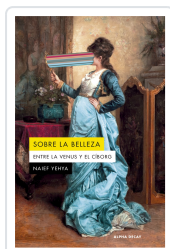
Sobre la belleza. Entre la Venus y el Ciborg Naief Yehya