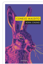
CONEJO MALDITO Chung, Bora