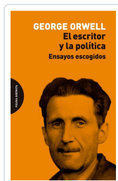
El escritor y la política Orwell, George