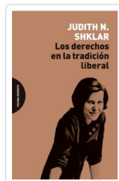
Los derechos en la tradición liberal Shklar, Judith N.