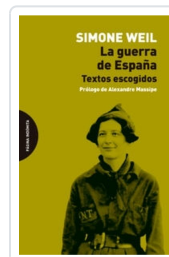
La guerra de España Weil, Simone