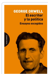
El escritor y la política Orwell, George