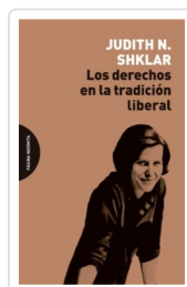
Los derechos en la tradición liberal Shklar, Judith N.