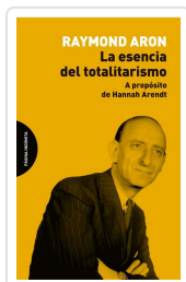
La esencia del totalitarismo Aron, Raymond