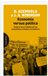
Economía versus política Acemoglu, Daron; Robinson, James A.