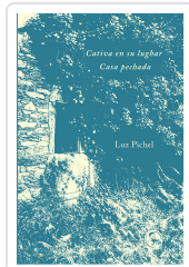
Cativa en su lughar / Casa pechada Pichel, Luz