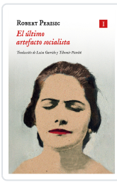
El último artefacto socialista Perišić, Robert