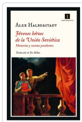
Jóvenes héroes de la Unión Soviética Halberstadt, Alex