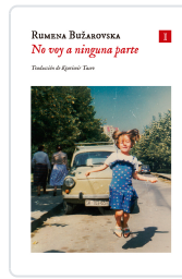
No voy a ninguna parte Bužarovska, Rumena