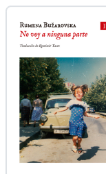
No voy a ninguna parte Bužarovska, Rumena