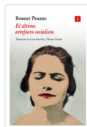
El último artefacto socialista Perišić, Robert