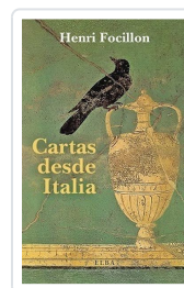
Cartas desde Italia Focillon, Henri