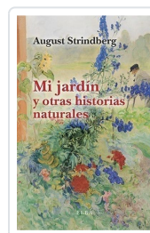
Mi jardín y otras historias naturales Strindberg, August