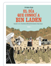
El día que conocí a Bin Laden Dres, Jérémie