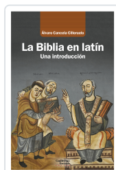
La Biblia en latín Cancela Cilleruelo, Álvaro