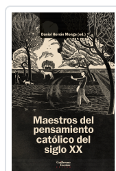
Maestros del pensamiento católico del siglo XX