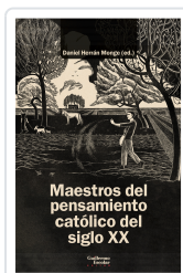
Maestros del pensamiento católico del siglo XX