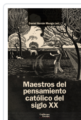
Maestros del pensamiento católico del siglo XX