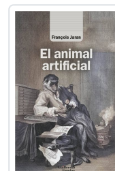
El animal artificial Jaran, François