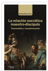
La relación socrática maestro-discípulo