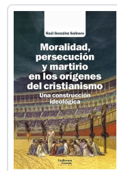
Moralidad, persecución y martirio en los orígenes del cristianismo González Salinero, Raúl