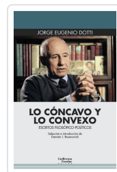
Lo cóncavo y lo convexo Dotti, Jorge Eugenio