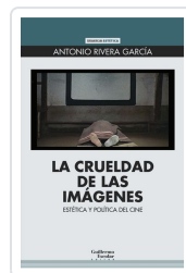
La crueldad de las imágenes Rivera García, Antonio