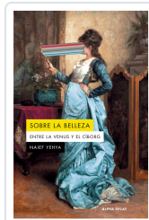
Sobre la belleza. Entre la Venus y el Ciborg Naïef Yehya