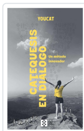
YOUCAT Catequesis en diálogo Varios autores