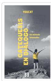
YOUCAT Catequesis en diálogo Varios autores