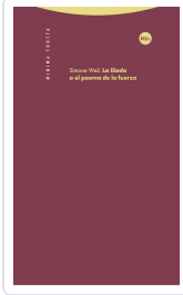
La 'Iliada' o el poema de la fuerza Weil, Simone