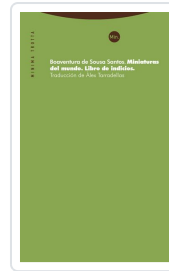
Miniaturas del mundo Santos, Boaventura de Sousa