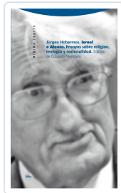
ISRAEL O ATENAS (2ª ED.) HABERMAS, JÜRGEN